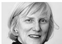
Dr. med. Therese Stutz Steiger Leiterin Sektion Neue Themen, Bundesamt für Gesundheit (BAG), Liebefeld b. Bern

Ähnlich wie Lesen und Schreiben für die Bewältigung des beruflichen und gesellschaftlichen Alltags notwendig sind, braucht es Gesundheitskompetenz, um gesund zu werden, gesund zu bleiben und gesundheitspolitische Entscheide zu fällen. Ausländische Studien lassen vermuten, dass es auch in der Schweiz vielfach an Gesundheitskompetenz fehlt. Zudem haben die Anforderungen, um sich im Gesundheitssystem zurechtzufinden, in den letzten Jahren stark zugenommen. Fehlende Gesundheitskompetenz wirkt sich jedoch nicht nur im Gesundheitswesen selbst, sondern auch in Wirtschaft, Gesellschaft und Politik aus.