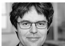
Dr. Stefan Spycher Leiter des Schweizerischen Gesundheitsobservatoriums (Obsan), Bundesamt für Statistik (BFS), Neuenburg

Die heutige Informations- und Wissensgesellschaft verlangt von den Bürgerinnen und Bürgern immer mehr Kompetenzen. Eine davon ist die Gesundheitskompetenz. Dieser Begriff, der im englischsprachigen Raum als «Health Literacy» schon seit einigen Jahren diskutiert wird, fasst im deutschsprachigen Raum erst allmählich Fuss. Gesundheitskompetenz ist die Fähigkeit jedes und jeder Einzelnen, im täglichen Leben Entscheidungen zu treffen, die sich positiv auf die Gesundheit auswirken (vgl. Kasten 1 ). Nutbeam (2000) unterscheidet drei Ebenen der Gesundheitskompetenz: